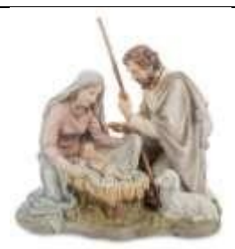
Б) Рождество Христово